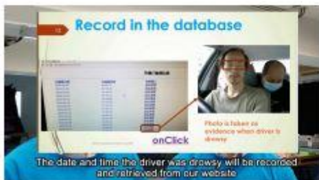
Figure 3 Driver Drowsiness Detection System - the winning team in the secondary school group.

"It is an amazing piece of work! The application can be used in driving safety monitoring, and some other applications like pilot safety control, security guard monitoring, classroom supervision, patient risks monitoring, etc," said Dr Adela Lau, Deputy Director of HKU SAAS Data Science Lab.