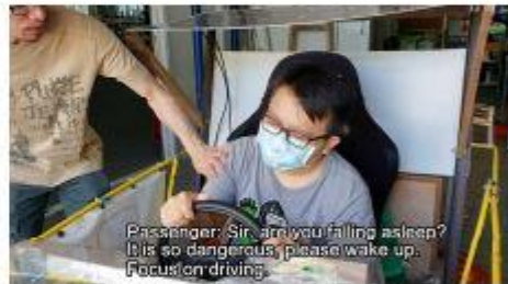
Figure 2 Driver Drowsiness Detection System - the winning team in the secondary school group

Through collaboration with HKU SAAS Data Science Lab in the STEMIP Junior Nurture Program (the competition), the student group from Heung To Secondary School (Tseung Kwan O) invented the Driver Drowsiness Detection System (DDDS) and converted the STEM education into innovation and practice (STEMIP). The DDDS involves STEM knowledge and skills such as Mathematics (probability), Engineering (Microcontroller and electronic appliances), and Technology (Python programming skills). The system integrates a new feature of voice and email system to give immediate alerts to the driver and the transportation company for risk assistance. It can greatly reduce the accident rate caused by driver's drowsiness.