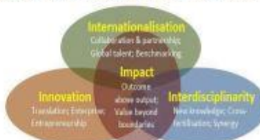
Figure 4 Our vision is based on the HKU's (3+1)Is: Internationalisation, Innovation and Interdisciplinarity, which converge to create collective Impact.

For more details about the winning proposals and the Competition, please visit: https://saasweb.hku.hk/datasci/competitions.php