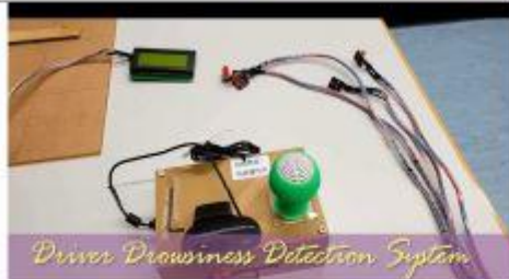
Figure 1 Driver Drowsiness Detection System- the winning team in the secondary school group